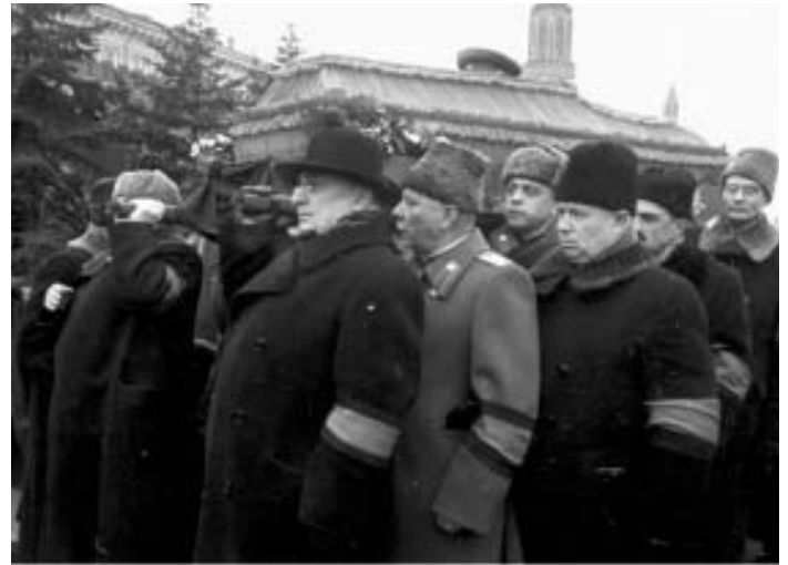
Рис. 40. Похороны И.В.Сталина. 9 марта 1953 г. На переднем плане слева направо: Л.П.Берия, К.Е.Ворошилов, Н.С.Хрущев, А.И.Микоян, М.А.Суслов.

После смерти Сталина «дело врачей» потеряло всякий государственный смысл. Более того, оно даже представляло опасность, вызывая угрозу стабильности внутри СССР и резкое падение престижа страны за рубежом. И по инициативе Л.П.Берии, ставшего после смерти Сталина первым заместителем председателя Совета Министров и министром внутренних дел СССР, был начат пересмотр дел, находящихся в производстве МГБ. Берия стремился упрочить свои позиции в борьбе за лидерство в партии и государстве, «заигрывал» с интеллигенцией, преследовал цель дискредитировать Игнатьева и вновь привести к руководству силовыми структурами своих людей. По его распоряжению 13 марта была создана следственная группа для пересмотра «дела врачей». Арестованным предложили изложить на бумаге претензии к следствию, пояснив им, что новое руководство страны не сомневается в их невиновности, и они должны помочь восстановить социалистическую