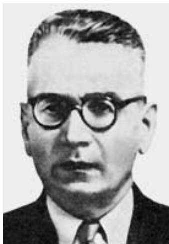
Рис. 25. Н.Н.Жуков-Вережников (1908–1981), вице-президент АМН СССР (1950–1953).

Следствие по делу профессора Этингера было поручено вести старшему следователю следственной части МГБ