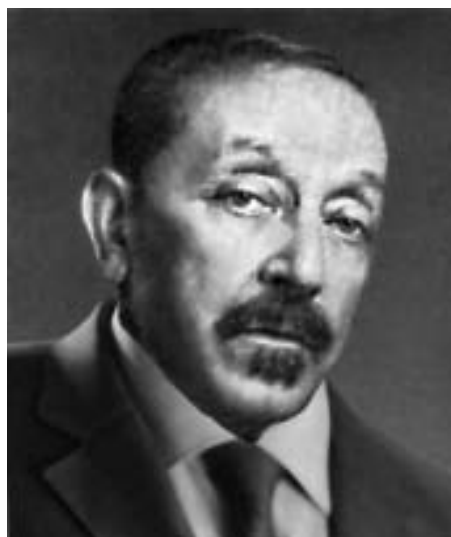
Рис. 43. Проф. М.И.Певзнер (1872–1952). Фото 1940-х гг.

Оглядывая из 21-го века картину жизни московской терапевтической элиты середины 20-го столетия, можно утверждать, что в одном ряду с наиболее авторитетными представителями столичной терапии (В.Н.Виноградов и В.Ф.Зеленин, А.Н.Крюков и А.И.Нестеров, М.С.Вовси и А.Л.Мясников, Е.М.Тареев и В.Х.Василенко) стоит и М.И.Певзнер. Как выдающийся терапевт и один из основоположников гастроэнтерологии и клинической диетологии в СССР, М.И.Певзнер занимает почетное место в истории клиники внутренних болезней (рис. 43).