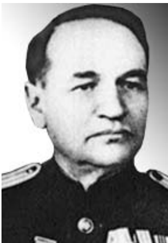
Рис. 35. Проф. В.Х.Василенко (1897–1987).

Единственным живым «врагом народа», названным Виноградовым, оказался ранее осужденный на 25 лет за шпионаж