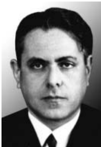
Рис. 18. Проф. О.С.Радбиль (1919–1993). Фото ок. 1960 г.