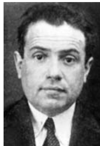
Рис. 14. Проф. Л.Б.Берлин (1896–1955). Фото ок. 1940 г.

подполковника медслужбы был главным терапевтом 8-й армии, затем – Западного фронта ПВО; награжден боевыми орденами «Красной Звезды» и «Отечественной войны» I степени, боевыми медалями.