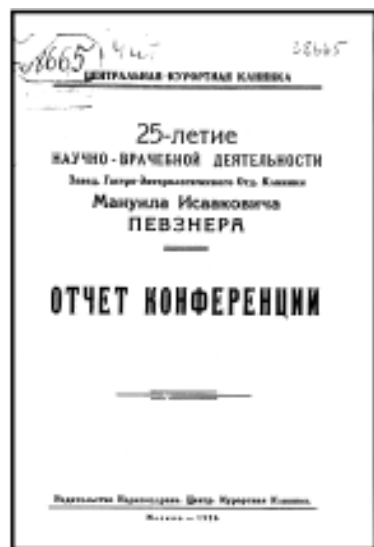
Рис. 3. Обложка брошюры, опубликованной в связи с 25-летием деятельности М.И.Певзнера. М., 1926 г.

После окончания университета Певзнер работал экстерном (1901, 1903–1907) в факультетской терапевтической клинике Московского университета (рис. 2) под руководством профессоров Василия Дмитриевича Шервинского и Леонида Ефимовича Голубинина. Подтверждение связи «учитель–ученик» мы находим в материалах состоявшегося