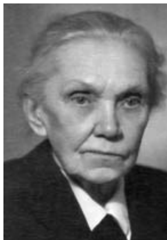
Рис. 26. Проф. О.П.Молчанова (1886–1975), директор Института питания АМН СССР (1947–1961).