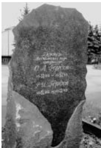
Рис. 41. Памятник на могиле О.Л.Гордона на Донском кладбище в Москве.