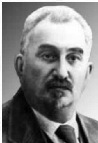
Рис. 12. Проф. Р.А.Лурия (1874–1944).