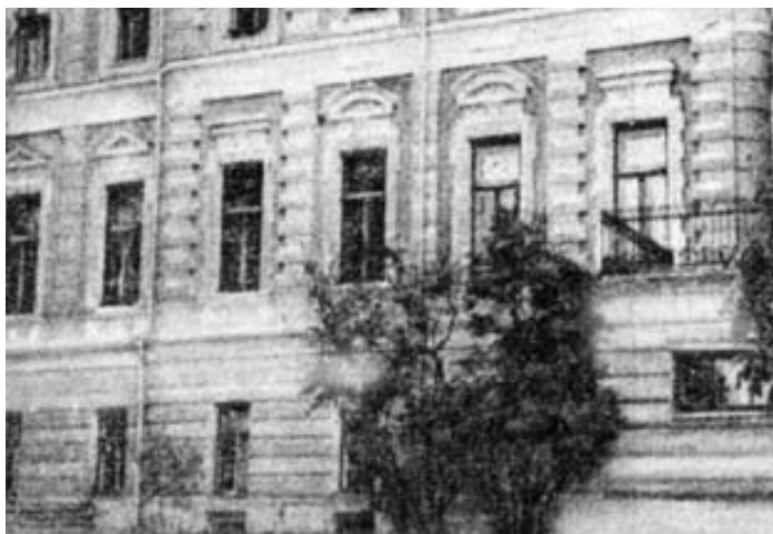
Рис. 8. Здание Клиники лечебного питания по адресу: Б. Николоворобинский пер., 7 (фото 1940-х гг.).

почек. Как писал сам М.И.Певзнер, было положено «начало новым воззрениям в области лечебного питания, связанным с отходом от органоидиототерапии и переходу к диетотерапии, влияющей на весь организм». Этой клиникой профессор М.И.Певзнер руководил до конца своей жизни.