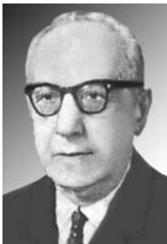
Рис. 11. Проф. С.М.Лейтес (1899–1972).