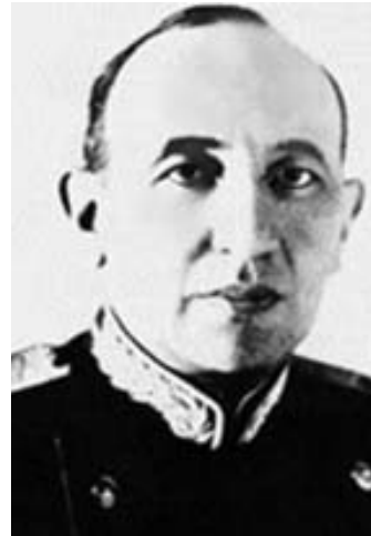
Рис. 37. Акад. АМН СССР М.С.Вовси (1897–1960).