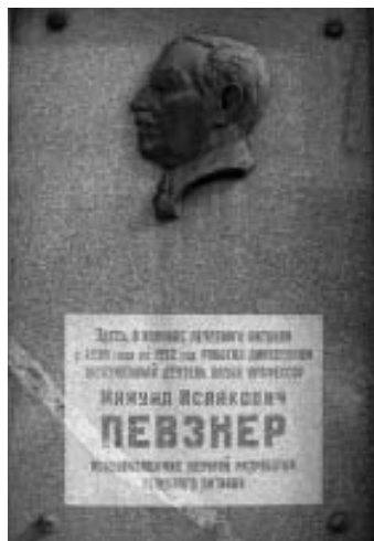
Рис. 42. Мемориальная доска М.И.Певзнера на фасаде здания клиники Института питания РАМН (Каширское шоссе, 21).

Дело врачей заканчивалось. Эта последняя репрессивно-политическая акция Сталина стала символом агонии его исторически обреченного страшного режима.