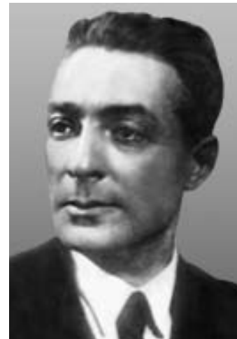
Рис. 7. Проф. Б.И.Збарский (1885–1954).

Клиника лечебного питания на 120 коек была открыта в старинном трехэтажном особняке с прилегающим к нему садом по адресу: Большой Николоворобинский пер., 7. Здание до революции принадлежало крупнейшему предпринимателю и меценату немецкого происхождения Гуго Морицевичу Марку (рис. 8). Клиника специализировалась на лечении (преимущественно с использованием лечебного питания) пациентов с болезнями органов пищеварения, обмена веществ (ожирение, диабет), гипертонической болезнью, ревматизмом, болезнями