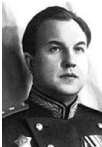
Рис. 22. В.С.Абакумов (1908–1954), министр гос. безопасности СССР (1946–1951).