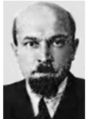
Рис. 38. Проф. Б.Б.Коган (1896–1967).