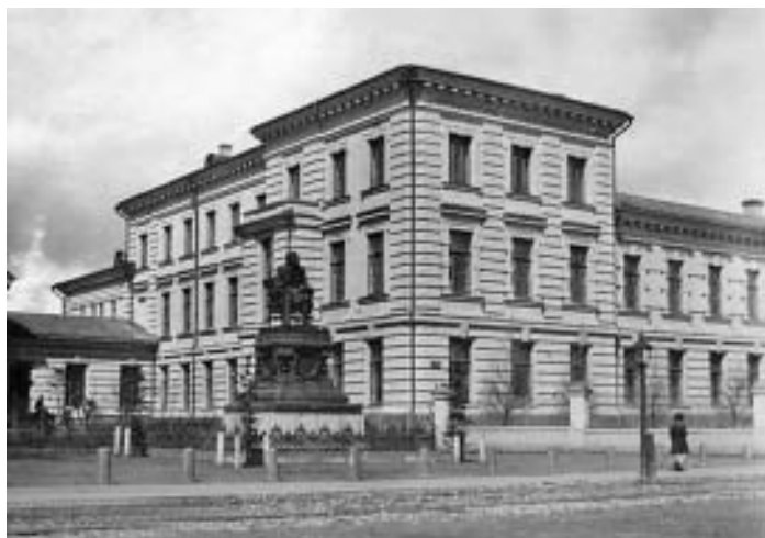
Рис. 2. Факультетская терапевтическая клиника Московского университета. Фото 1901 г.

верситета за участие в студенческих беспорядках, но через полгода был принят обратно и окончил медфак Московского Университета в 1900 г.» [5].