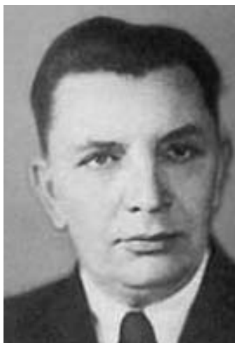
Рис. 31. С.Д.Игнатьев (1904–1983), министр гос. безопасности СССР (1951–1953).

11 июля 1951 г. Политбюро ЦК ВКП(б) принимает постановление «О неблагоприятном положении в Министерстве государственной безопасности СССР», в котором прямо указывается на «безусловно существующую законспирированную группу врачей, выполняющих задания иностранных агентов по террористической деятельности против руководителей партии и правительства». На должность министра госбезопасности 9 августа 1951 г. был назначен С.Д.Игнатьев (рис. 31), заведующий Отделом партийных, профсоюзных и комсомольских органов ЦК ВКП(б). 4 октября 1951 г. Рюмину присвоили звание полковника, а 19 октября (после того, как он направил Сталину новое разоблачительное письмо, на этот раз, о вредительстве в работе руководящего состава органов МГБ СССР) он был назначен заместителем министра госбезопасности и начальником следственной части по особо важным делам.