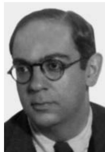
Рис. 32. Исайя Берлин (1909–1997). Фото ок. 1945 г.

По трагизму ситуации смерть Певзнера парадоксально переключается с историей смерти его немецкого коллеги и учителя Исмара Боаса. После установления нацистской дик-