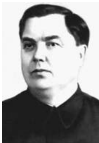
Рис. 21. Г.М.Маленков (1902–1988), сов. госуд. и парт. деятель.