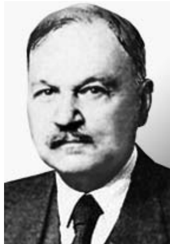
Рис. 36. Акад. АМН СССР В.Н.Виноградов (1882–1964).