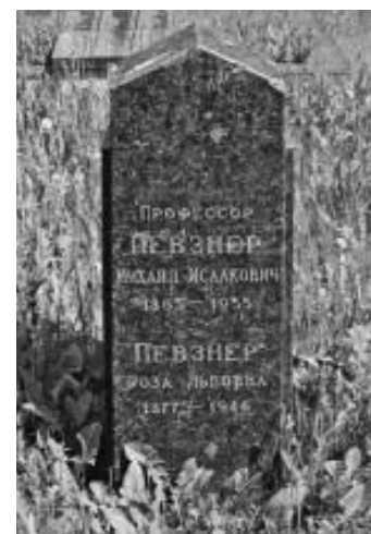
Рис. 34. Памятник на могиле Михаила Исааковича и Розы Львовны Певзнеров на мемориальном кладбище в Смоленске.