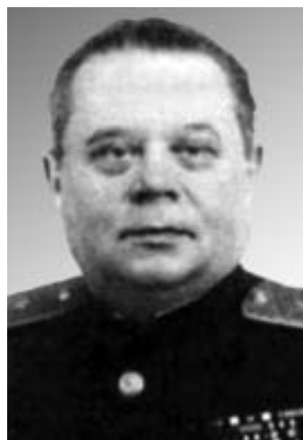
Рис. 23. В.Е.Макаров (1903–1975), зав. Административным отделом ЦК ВКП(б) в 1950 г.