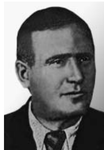
Рис. 17. Проф. М.С.Маршак (1899–1970). Фото ок. 1950 г.

чебного (в больницах и санаториях, на курортах, для лиц, работающих с вредными веществами) и общественного (диетического, лечебно-профилактического) питания [42–47]. Всего им было написано более 150 статей и 18 руководств, монографий и пособий по этой проблеме. Долгие годы он был консультантом по диетологии министерств здравоохранения СССР и РСФСР. В 1967 г. профессор М.С.Маршак с почетом ушел на пенсию, проработав в Институте питания 37 лет [48].